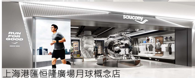
上海港匯恒隆廣場月球概念店