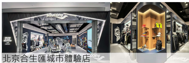
北京合生匯城市體驗店

新店設計完美結合月亮和冠軍元素。概念店以「裂變月球」的視覺空間設計，突顯索康尼的核心跑鞋技術；而城市體驗店則延續了入口處的月亮概念設計，向1965年宇航員穿著索康尼太空鞋完成太空漫步的歷史性時刻致敬。城市店內更融入了北京的標誌性跑步路線，為索康尼百年工藝開啟新篇章。